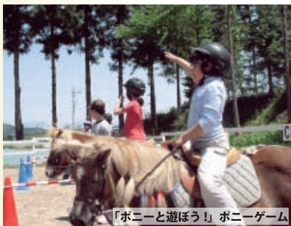
「ポニーと遊ぼう!」ポニーゲーム